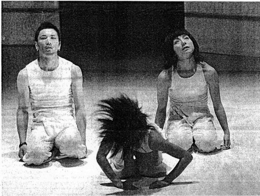
Die Leno-Bassi Dance Company aus Japan lässt man sich vom Tanz befallen.